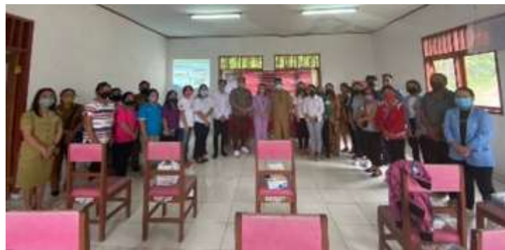
Gambar 2. Foto bersama Perangkat Kecamatan Suluun Tareran dan Peserta

Selain memberikan teknologi, tim pelaksana juga melakukan pelatihan penggunaannya dan pelatihan manajemen usaha dan manajemen keuangan untuk mitra sasaran. Hal tersebut untuk meningkatkan pengetahuan mitra dalam penggunaan teknologi yang diberikan. Tahap terakhir yang dilakukan yaitu melakukan uji coba langsung kepada mitra penjual di pasar.