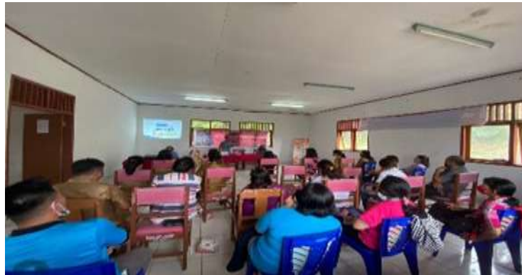
Gambar 1. Foto Saat Pelatihan Pengoprasikan Aplikasi E-Market

perbaikan aplikasi. Materi terakhir disampaikan oleh Abdurahman Rigel Hullah, SE, MSA, Ak. Dengan topik Strategi Pemasaran Online. Pada materi ini, peserta dibekali dengan pengetahuan tentang bagaimana cara menjual barang lewat platform online. Antusias sangat terlihat karena banyak pertanyaan yang ditanyakan para peserta tentang materi ini. Kegiatan diakhiri dengan penyerahan Aplikasi E-Market kepada Camat Suluun Tareran.