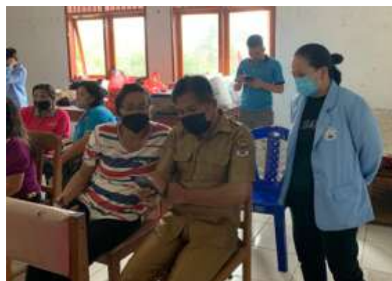
Gambar 3. Pelatihan ke Mitra Sasaran

Selain memberikan teknologi, tim pelaksana juga melakukan pelatihan penggunaannya dan pelatihan manajemen usaha dan manajemen keuangan untuk mitra sasaran. Hal tersebut untuk meningkatkan pengetahuan mitra dalam penggunaan teknologi yang diberikan. Tahap terakhir yang dilakukan yaitu melakukan uji coba langsung kepada mitra penjual di pasar.