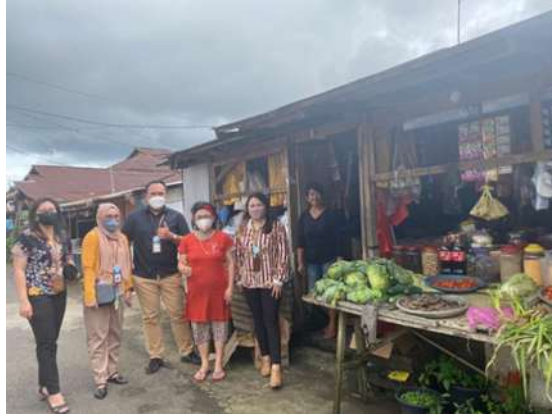
Gambar 4. Kunjungan ke Mitra Penjual.